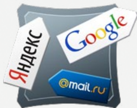
Продвижение сайтов по ключевым словам

Студия «Оверпин» предлагает полный спектр услуг по продвижению сайта, и гарантирует достижение запланированных показателей.