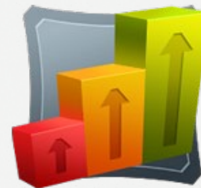
Продвижение сайтов по трафику